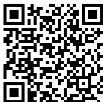
全空連マイページ QRコード