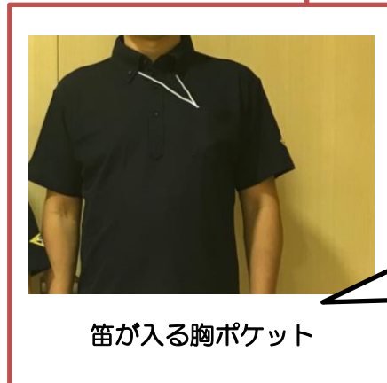
笛が入る胸ポケット