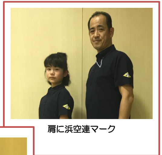
肩に浜空連マーク